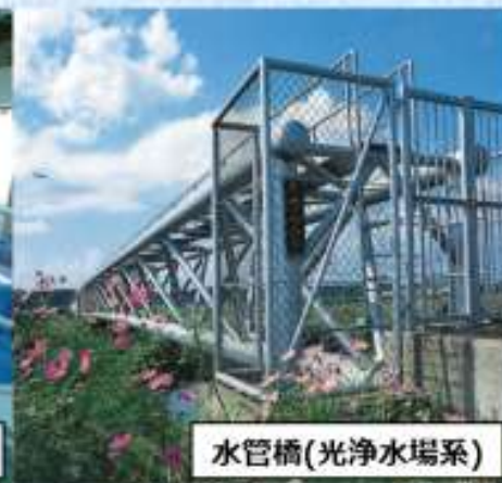
水管橋(光浄水場系)