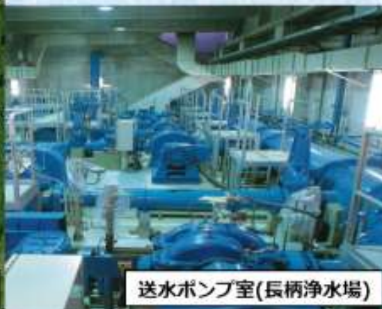
送水ポンプ室(長柄浄水場)