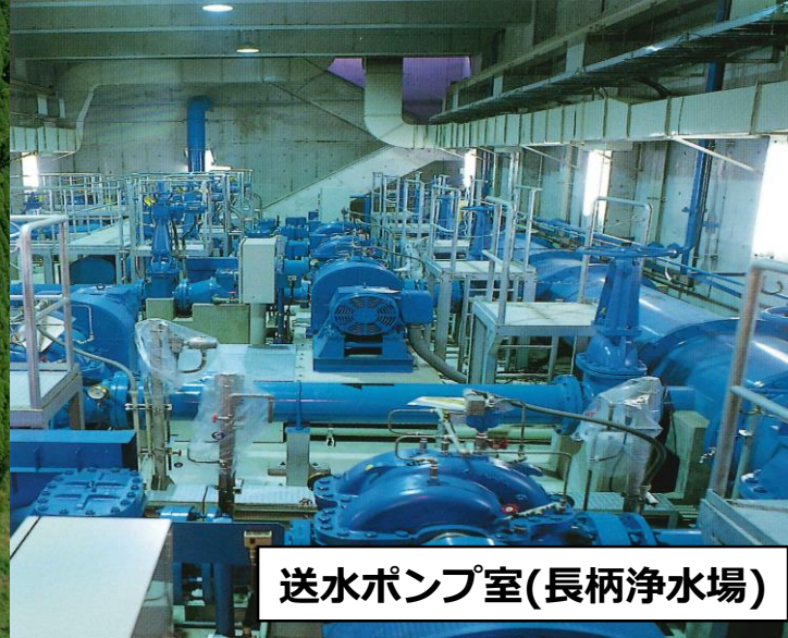
送水ポンプ室(長柄浄水場)