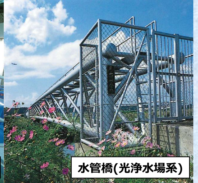
水管橋(光浄水場系)