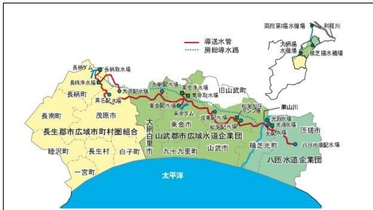
九十九里地域水道企業団の概要図

以来、地域住民の方々の健康的な生活を支えるため、3つの受水団体を通じて、清浄な水道水を安定的に給水することを最大の目標として、生活に欠かせない重要なライフラインに携わる者としての使命感を持ち、職員一丸となって取り組んでいます。